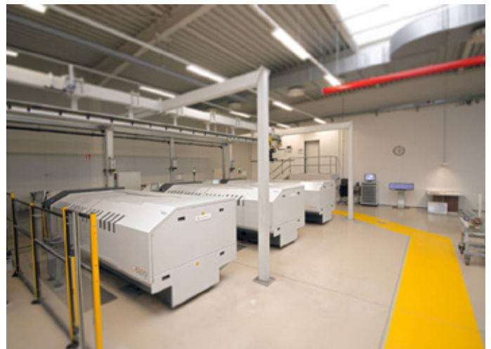
Als Pionier der Lasergravur verfügt 4P heute über drei Cellaxy

Die langjährige Erfahrung im Einsatz lasergravierter Zylinder sowie das umfassende Know-how in der drucktechnischen Umsetzung ermöglichen es 4P jetzt, die Druckcharakteristiken