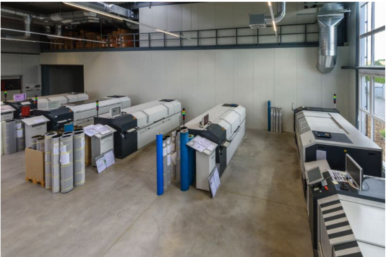
Aktuell fertigt Flex-Punkt mit fünf Direktlasern sowie zwei LAMS-Lasern von HELL.

Einen Anteil an der anhaltend erfolgreichen Entwicklung von Flex-Punkt hat HELL Gravure Systems. Beide Unternehmen verbindet eine 20-jährige, sehr fruchtbare und vertrauensvolle Zusammenarbeit. Bereits im Jahr 2001 führte Flex-Punkt den Betatest für die erste Lasergravuranlage von Hell durch. Aktuell werden mit fünf Direktlasern sowie zwei LAMS-Lasern von Hell elastomere und fotopolymere Sleeves und Platten gefertigt.